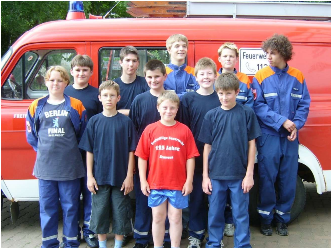
Ein paar Jahre später: